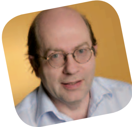
Foto Umwelt Tipp!

„Verwenden Sie zum Aufladen Ihrer Akkus doch ein Solar-Ladegerät. Es ist effizient und energieschonend und passt zu allen gängigen Akkus unserer Digitalkameras und allen USB-Anschlüssen.“